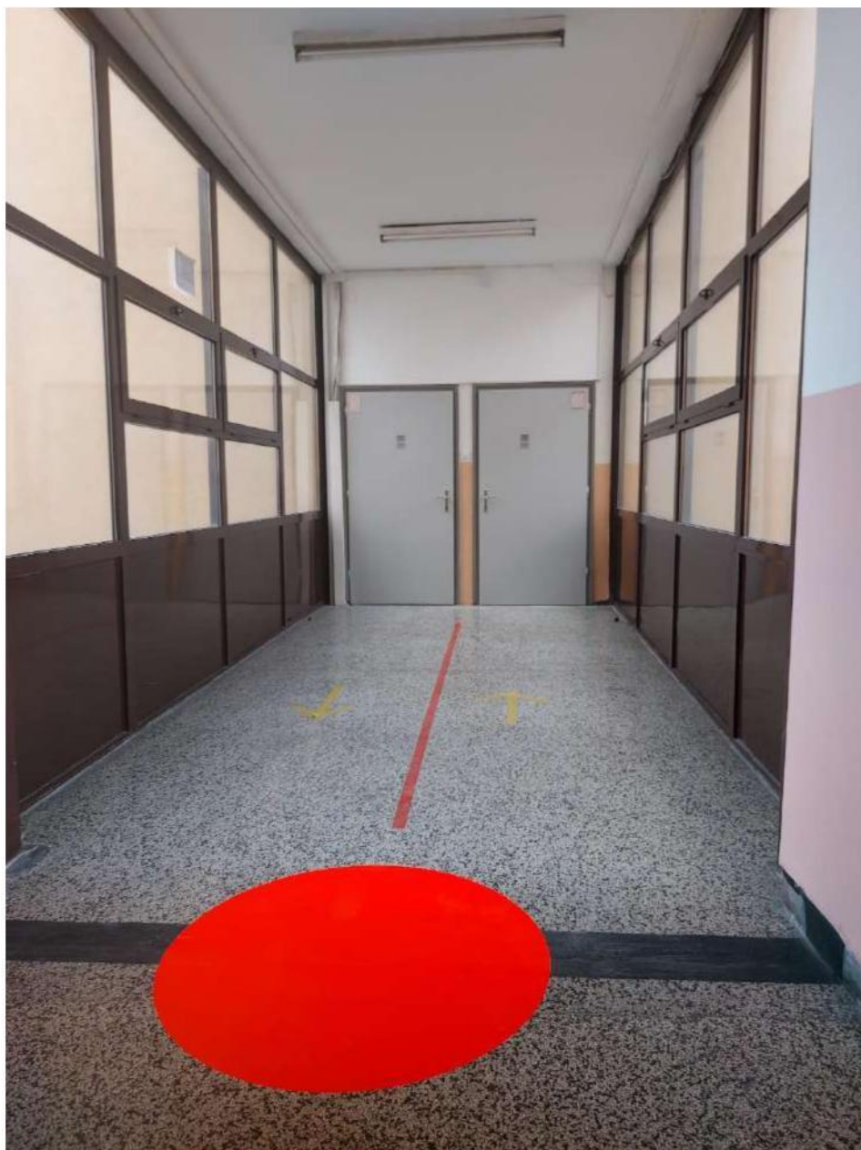
Slika 9 - potencijalno rizična mjesta (označena podnim oznakama u obliku crvenog kruga)

Sve osobe koje se u trenutku potrebe za evakuacijom nađu u dijelovima hodnika označenim kao potencijalno rizična mjesta (označena podnim oznakama u obliku crvenog kruga, a na planu evakuacije označeno crvenim krugovima) trebaju se što prije odmaknuti dalje od tih mjesta. Nakon potresa potrebno je nastaviti s evakuacijom prema najbližem sigurnom izlazu (u smjeru strelica za evakuaciju).