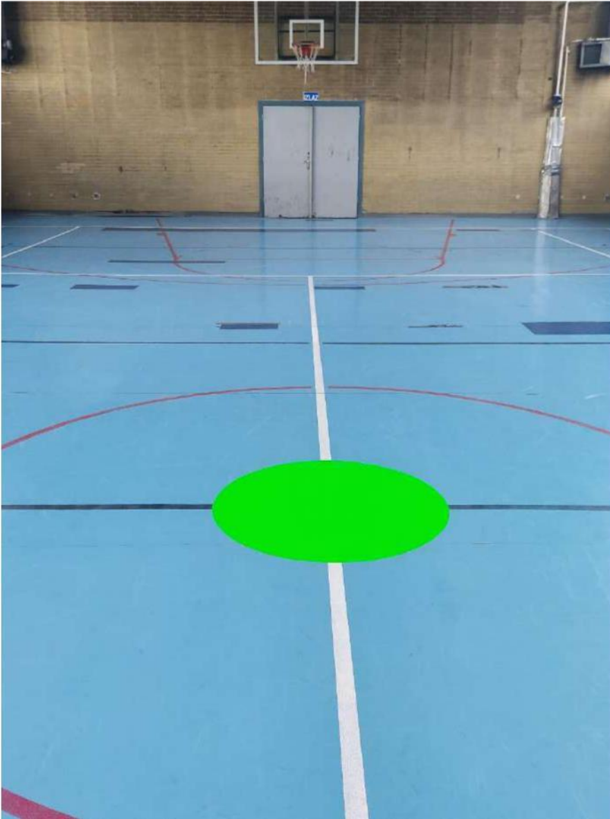
Slika 4 - sigurno mjesto sportska dvorana - na sredini dvorane (označeno podnom oznakom u obliku zelenog kruga)

U sportskoj dvorani i polivalentnoj dvorani sigurno mjesto je na sredini dvorane označeno je zelenom naljepnicom na podu.