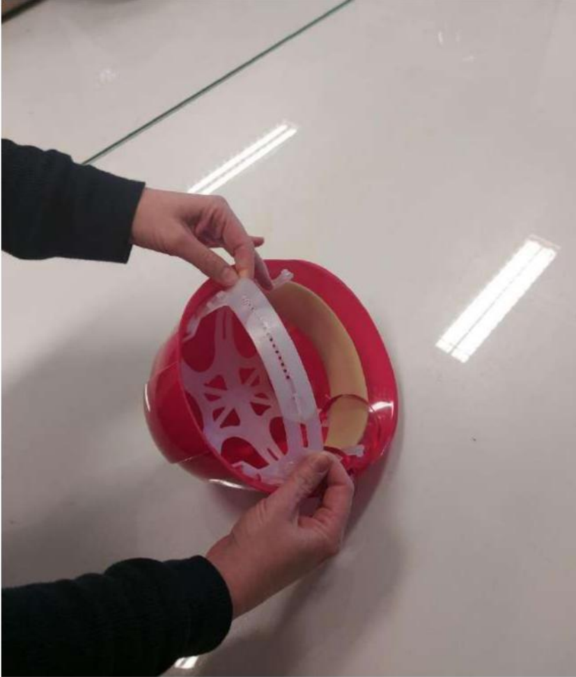
Slika 23 - podešavanje veličine zaštitne kacige

Sve zaštitne kacige imaju mogućnost podešavanja veličine.