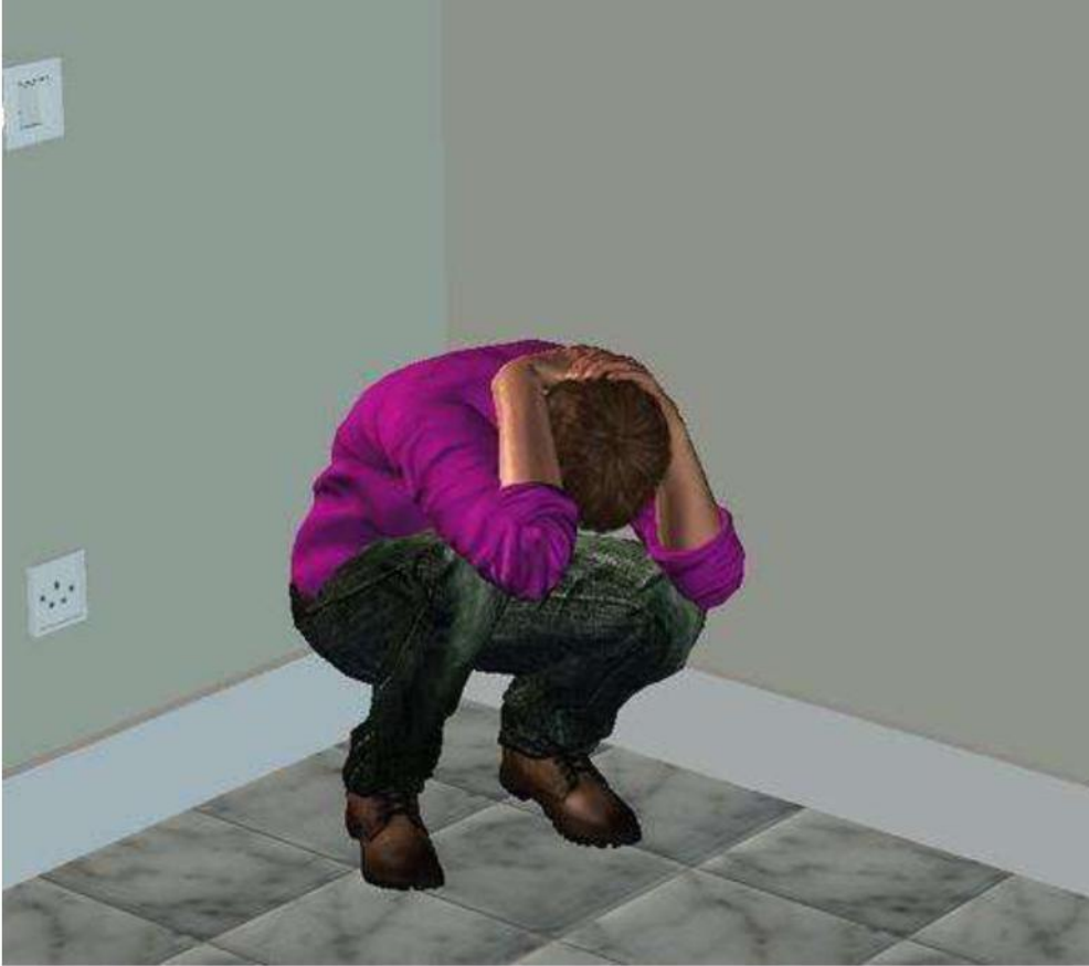
Položaj tijela tijekom potresa – čučnuti licem okrenutim prema dolje i rukama prekriti glavu

Ukoliko ste za vrijeme potresa vani, potrebno se odmaknuti od građevina, stupova, dalekovoda i drveća.