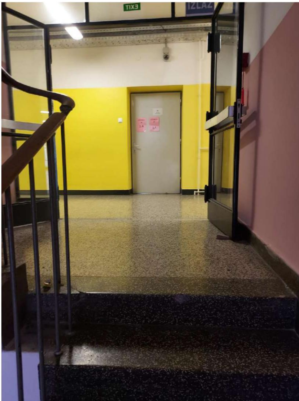
Slika 16- stepenice prema 2. katu Upravne škole Zagreb

Sve osobe koje se u trenutku potrebe za evakuacijom zateknu u kemijskom laboratoriju napuštaju prostorije škole uspinjući se stepenicama na 2. kat Upravne škole Zagreb, odlaze na krajnji zapadni dio hodnika te koriste zapadni izlaz Tekstilno-tehnološkog fakulteta prema ulici Prilaz baruna Filipovića te odmah odlaze na zbornu mjesto.