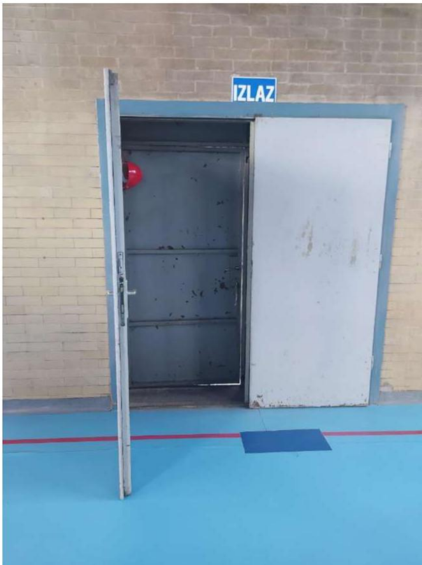
Slika 14- izlaz kroz dvoranu

Sve osobe koje se u trenutku potrebe za evakuacijom zateknu u radionicama C i D napuštaju prostore Škole spuštajući se stepenicama do sportske dvorane , koriste evakuacijski izlaz sportske dvorane te skrenu odmah lijevo prema zbornom mjestu - teniskom terenu. Ključevi evakuacijskog prolaza sportske dvorane su u bravi drugih vrata kao i ključ od teniskih terena.