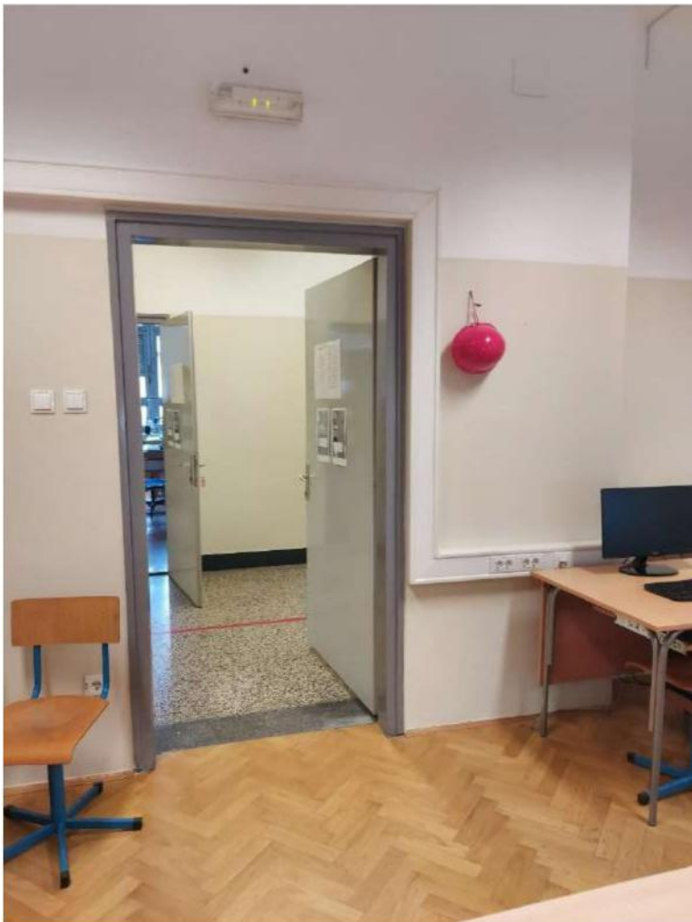
Slika 20 - kaciga za nastavnike (pored izlaza iz svake učionice)

Pored svakih vrata s unutarnje strane učionice nalazi se zaštitna kaciga (EN 397) za nastavnike.