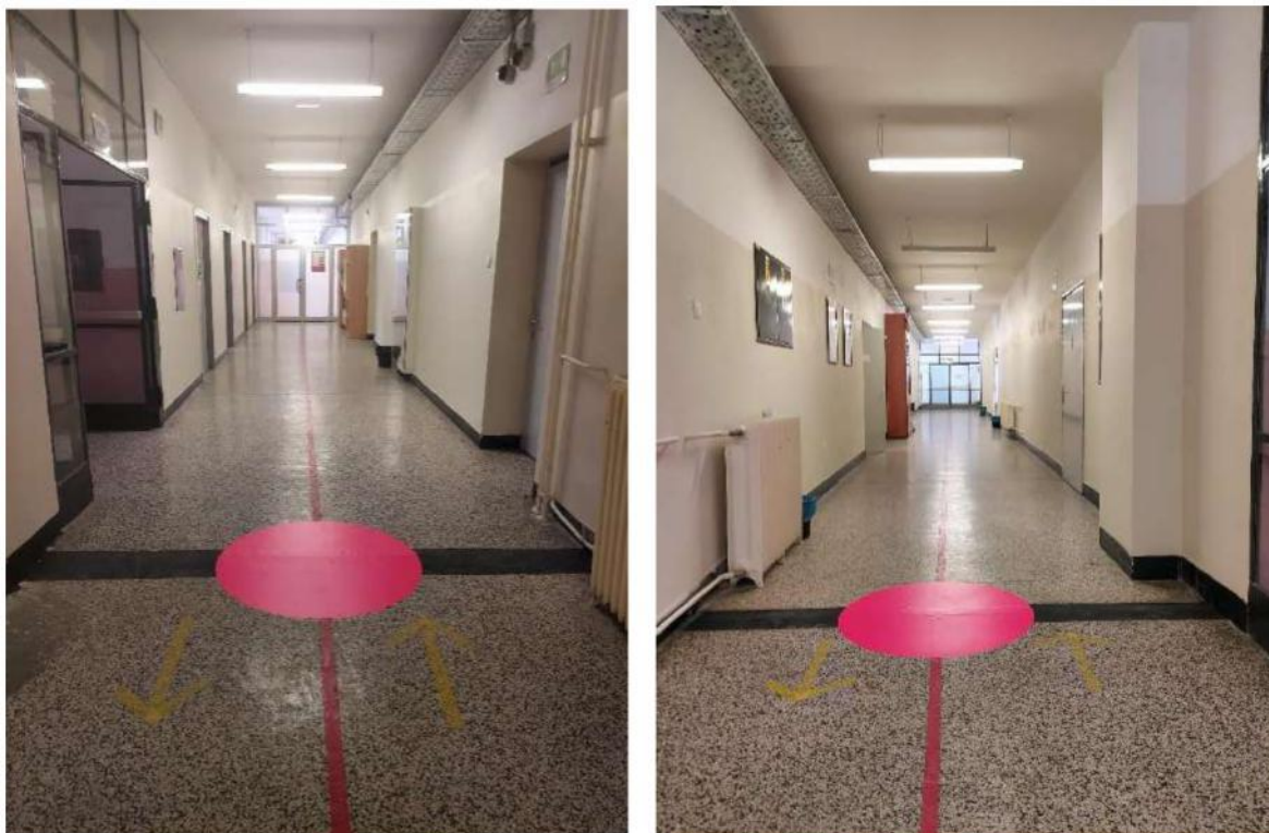
Slika 2 - potencijalno rizična mjesta (označena podnim oznakama u obliku crvenog kruga)

U kemijskom laboratoriju sigurno mjesto je pored nosivog stupa i označeno je zelenom naljepnicom na podu.