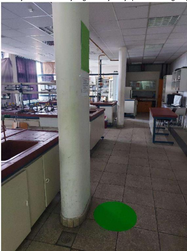
Slika 3 - sigurno mjesto kemijski laboratorij - pored nosivog stupa (označeno podnom oznakom u obliku zelenog kruga)

U kemijskom laboratoriju sigurno mjesto je pored nosivog stupa i označeno je zelenom naljepnicom na podu.