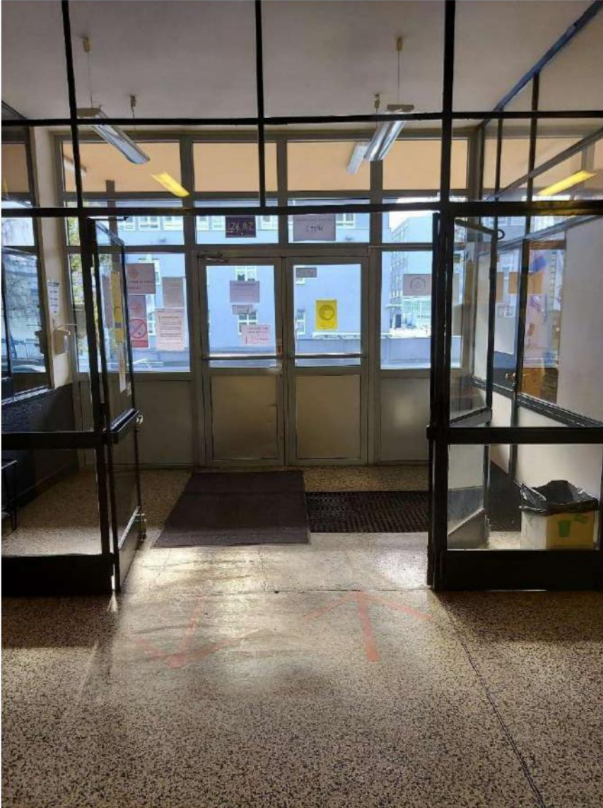
Slika 7 - Glavni (istočni) izlaz

Sve osobe koje se u trenutku potrebe za evakuacijom zateknu u podrumskim prostorima Škole, uspinju se stepenicama prema prizemlju Škole te koriste glavni (istočni) izlaz za evakuaciju te odmah odlaze na zbornu mjesto.