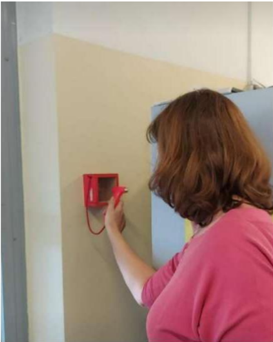
Slika 19 - razbijanje kutije s rezervnim ključevima za vrata prema Tekstilno-tehnološkom fakultetu

Kutija s rezervnim ključevima za vrata prema Tekstilno-tehnološkom fakultetu – Kutiju s rezervnim ključevima i vrata prema hodniku Tekstilno-tehnološkog fakulteta potrebna za evakuaciju razbija i otvara osoba koja prva stigne do predmetnih vrata.