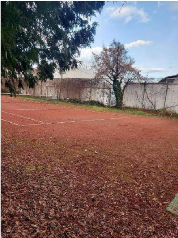
Slika 6 - zborni mjesto - teniski teren pored potoka