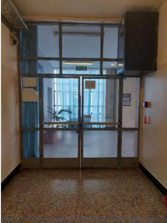
Slika 10 - Prolaz prema Tekstilno-tehnološkom fakultetu, 1. kat

Sve osobe koje se u trenutku potrebe za evakuacijom zateknu na 1. katu škole napuštaju prostore Škole na način da se upute na krajnji zapadni dio hodnika kod učionice 6/1 te koriste zapadni izlaz Tekstilno-tehnološkog fakulteta prema ulici Prilaz baruna Filipovića te odmah odlaze na zborna mjesto.