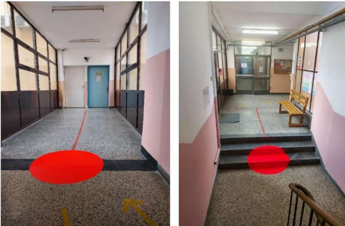
Slika 1 - potencijalno rizična mjesta (označena podnim oznakama u obliku crvenog kruga)

Sve osobe koje se u trenutku potrebe za evakuacijom nađu u dijelovima hodnika označenim kao potencijalno rizična mjesta (označena podnim oznakama u obliku crvenog kruga, a na planu evakuacije označeno crvenim krugovima) trebaju se što prije odmaknuti dalje od tih mjesta.