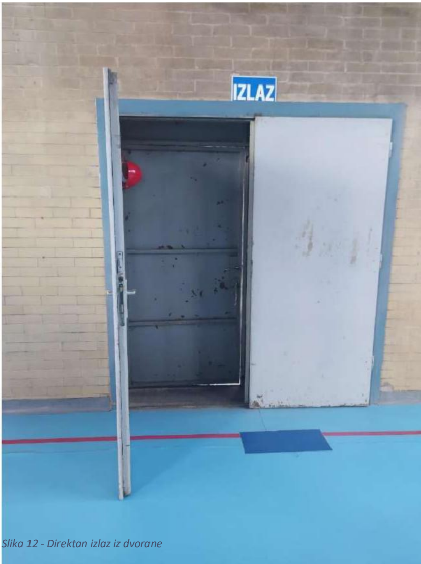
Slika 12 - Direktan izlaz iz dvorane

U sportskoj dvorani i polivalentnoj dvorani sigurno mjesto je na sredini dvorane i označeno je zelenom naljepnicom na podu.