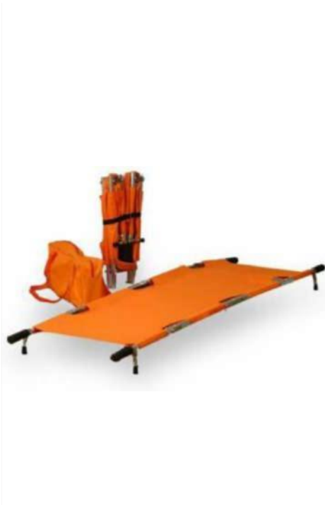
Slika 18 - sklopiva nosila Venus 4

Sklopiva nosila Venus 4 nalaze se u zbornici uz oglasnu ploču s lijeve strane i u učionici 10/1 kod umivaonika.