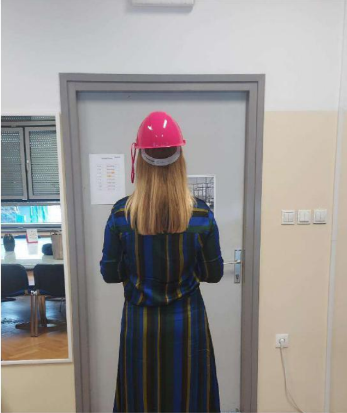
Slika 21 - izgled nastavnika tijekom evakuacije (nosi crvenu zaštitnu kacigu).

Nastavnici Škole za modu i dizajn nose crvene zaštitne kacige, radi lakšeg raspoznavanja.