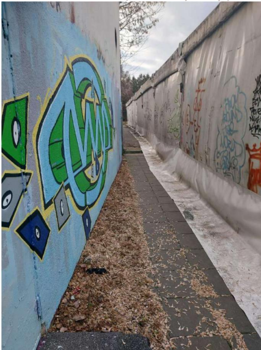
Slika 13 - put iz dvorane prema zbornom mjestu