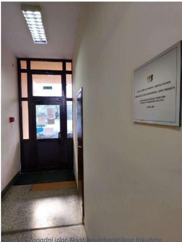
Slika 11 - Zapadni izlaz Tekstilno-tehnološkog fakulteta