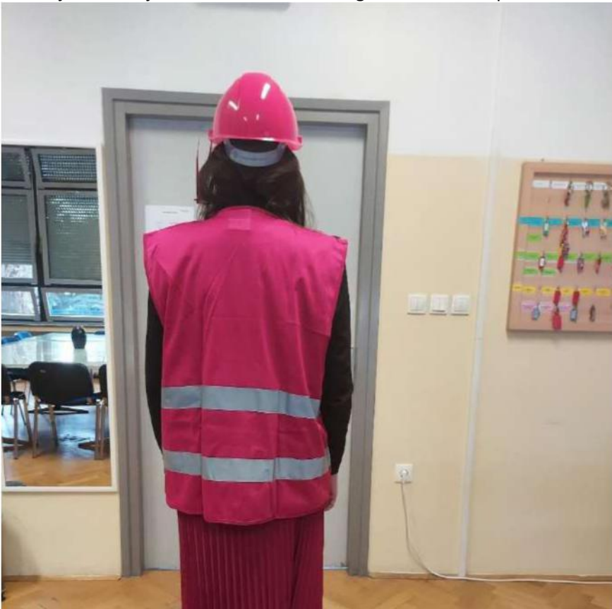
Slika 22 - izgled voditelja evakuacije tijekom evakuacije (nosi crvenu zaštitnu kacigu i crveni prsluk)

Voditelji evakuacije uz crvene zaštitne kacige nose i crvene prsluke.