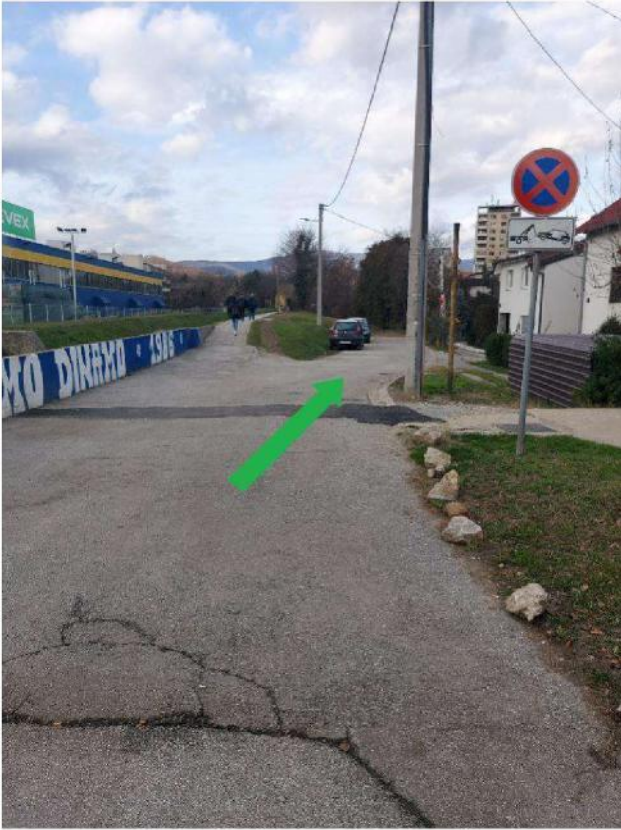
Slika 5 - evakuacijski put prema zbornom mjestu

Zborno mjesto za sve osobe prilikom evakuacije je na teniskim terenima pored potoka.